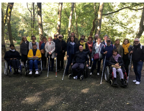
Parc de la Chartreuse – Session Liège 2018

Pour terminer, après une approche théorique de la norme en accessibilité, nous avons été guidés par les membres d'un bureau d'étude vers la pratique d'espaces et parcours aménagés à travers la ville dans les conditions de PMR au travers de la simulation de trois limitations : non-voyant, mal-voyant et handicap moteur (en chaise roulante).