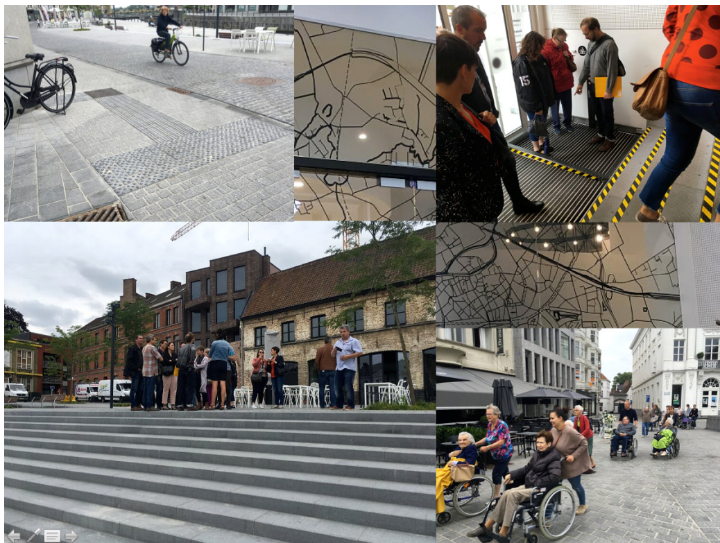
Visite des aménagements de la ville de Courtrai – Session Mons 2018.

Nous avons rencontré différents porteurs de projets (CATUs, échevins, entrepreneurs, etc.) et échangé avec eux sur leur expérience de terrain. Plusieurs villes et villages ont déjà anticipé l'action et développé de multiples actions, services et outils opérationnels.