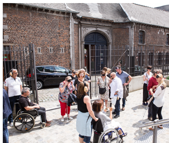
Praticabilité des espaces accessibles: parcours d'espaces aménagés à travers la ville dans les conditions de PMR – session 2018 Mons