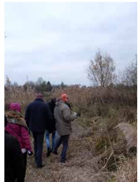
Zone d'inondation temporaire co-gérée par la province et Natuurpunt à Hoenshoven (Limbourg).

Ces journées de terrain hors des frontières wallonnes explorent des approches similaires, complémentaires, voire inédites par rapport à celles menées en Wallonie.